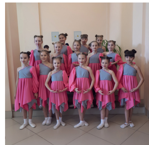
Средняя группа на международном конкурсе «Золотая Ника» в номинации «Современная хореография, 8-10 лет» заняла 2 место и получила Кубок, а в номинации «Детский танец, 8-10 лет» – 3 место и Кубок.