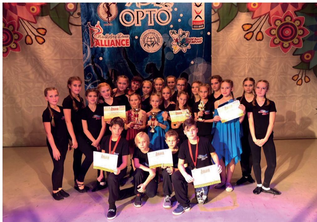
Старшая группа на международном конкурсе «Золотая Ника» заняла 2 место и получила Кубок в номинациях «Современная хореография, 11-13 лет» и «Модерн, 11-13лет».