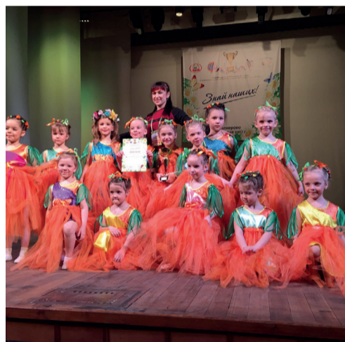
Младшая группа на международном конкурсе «Золотая Ника» заняла 2 место и получила Кубок в номинации «Бэби-шоу, 5-7 лет».