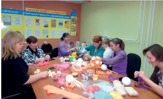
Сделать уникальный подарок своими руками ко дню матери могли все желающие.

18 ноября, в преддверии празднования Дня Матери, в Центре по работе с населением «Лесная Поляна» была организована выставка изделий ручной работы «Я горжусь тобой,