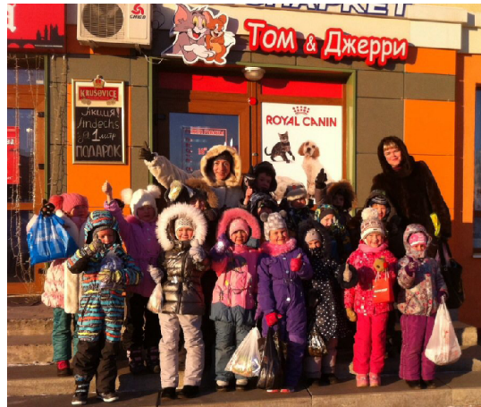
ФОТОГРАФИИ ЭМИЛИИ САВОЖЕНОЙ

Третий раз с начала года Кемеровская городская общественная организация «Общество защиты животных» провела в Лесной Поляне акцию «Накорми бездомное животное». Эта акция – возможность помочь животным, которым не повезло с хозяевами, почувствовать себя сытыми. Четвероногие бездомные полностью зависят от нашей доброты и сострадания. Корма, крупы, мясные продукты и многое другое передали жители нашего района через зоомагазин «Том и Джерри» – постоянного партнера акции – приюту для бездомных животных «Верный».