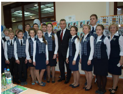
Выбор уполномоченным по правам ребенка гимназии №42 для организации библиотеки подчеркивает ее уникальность.

«Привёз с собой две тонны книг. Это около 1500 наименований, книги для детей разных возрастов. Книги никто не отменял. Когда я не в командировке, дома своему младшему сыну на ночь читаю сказки», — прокомментировал Павел Астахов. Первую библиотеку с книгами от Астахова открыли в прошлом году на базе городской больницы в Новосибирске, а вторая появилась в мае 2015 года в реабилитационном центре для детей-инвалидов в Грозном.