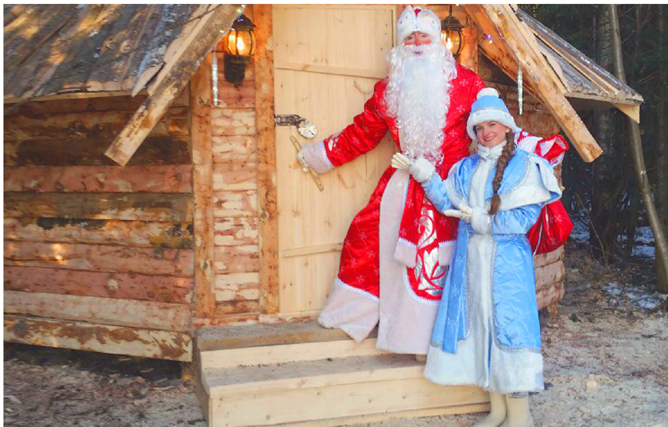
Лесная Поляна – любимая резиденция Деда Мороза!