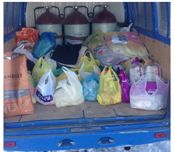
В результате мероприятия в Лесной Поляне удалось собрать солидную помощь приюту «Верный».

«Жители Лесной поляны всегда отличаются своей сплоченностью в желании помочь нуждающимся животным! Особую благодарность хотим выразить ребятам, специально приехавшим в Поляну из города, чтобы передать гостинцы для питомцев приюта. Спасибо Вам ребята, за Ваши добрые сердца! И отдельную благодарность руководству зоомагазина за помощь в организации акции и посылку для приюта.»