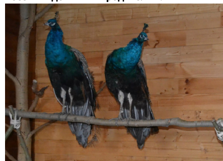
Если Фунтику, Маше и Даше холод нипочем, то этим заморским птицам лучше около печки.

«Сложно проехать мимо него «Вовкиного двора»! Живописная территория вокруг радует глаз. Мы покупали угощение для зверят, моя дочь просто пиццала от восторга, когда кормила зверюшек! Внутри нас встретили милые кролики, морские свинки, черепахи, кот, который "косит" под черепаху, питоны, попугаи, белочки, ежики, гуси и еще много-много забавных животных! В общем, здесь здорово, тепло и уютно! Рекомендуем посетить детям и их родителям!»