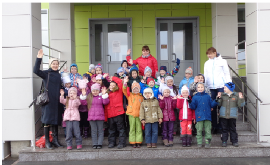
Очень скоро для многих из этих ребят новая школа станет родной на многие годы.

Осень нечасто балует нас теплыми солнечными днями, но в один из ноябрьских дней, когда веселой гурьбой ребята старшего дошкольного возраста МАДОУ № 26 «Центр развития ребенка – детский сад» отправились в недавно открывшуюся среднюю общеобразовательную школу № 85, стояла исключительно теплая погода, добавляющая радости предстоящему мероприятию.