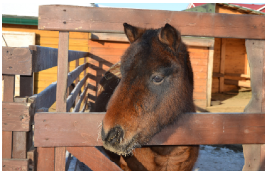
Наступили холода, но «Вовкин двор» продолжает принимать гостей.

Кто-то из животных переехал в тепло, а те, кому морозы не почем, остались на улице - например, пони Фунтик, который к зиме оделся в теплую шубку, козы Машка и Дашка, которым на улице комфортней чем в доме.