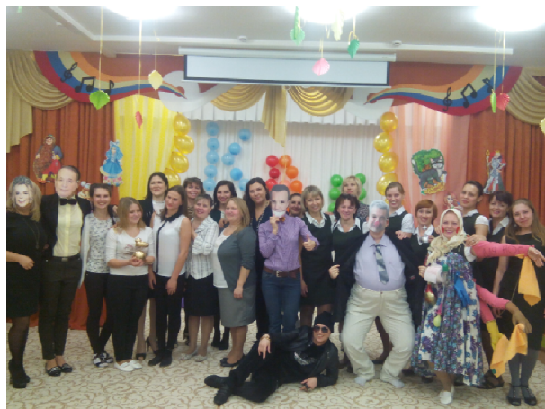
«Звездный» состав жюри был на уровне премьер-лиги КВН.

8 ноября отмечается Международный день Клуба Веселых и Находчивых. КВН, объединяющий людей во всем мире, обязывает быть веселым и находчивым не только на сцене, но и в жизни. Поэтому МАДОУ № 26 «Центр развития ребенка – детский сад» не остался равнодушным к этому празднику! 6 ноября в музыкальном зале детского сада встретились две команды педагогов «Ход конем» и «Веселые девчата», которых объединила общая тема КВН: «Сказка ложь, да в ней намек...».