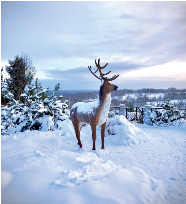
Скульптура оленя на улице Медовая