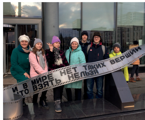
Очень запоминающимся было посещение смотровой площадки, находящейся на 52-м этаже небоскреба «Высоцкий». Это захватывающее зрелище! Весь город как на ладони с высоты птичьего полета.