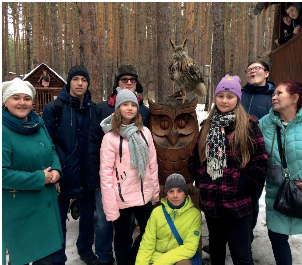
А вам когда-нибудь удавалось находиться одновременно в Европе и Азии? Если нет, то мы расскажем, как это сделать.

Во время весенних каникул мы совершили путешествие в Екатеринбург – хотим вам о нем рассказать. Каждый день оставил у нас яркие впечатления, мы узнали много нового об истории государства, о местных производствах и достопримечательностях, о разных профессиях и о замечательных людях земли Урала.