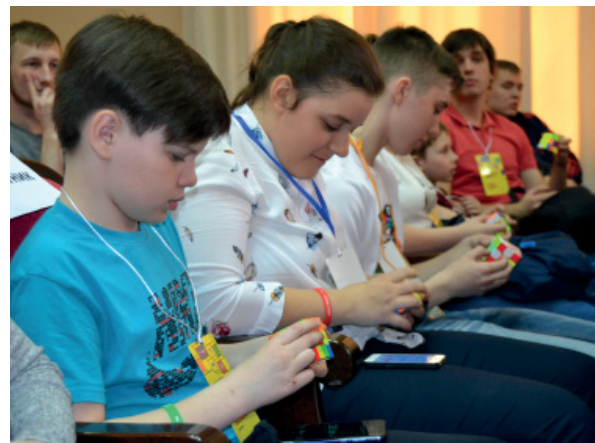
фото из архива Гимназии №42