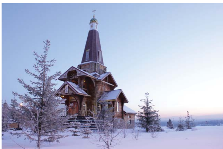
Подпись к фото