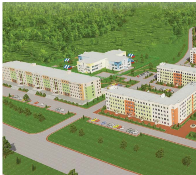
Подпись к фото