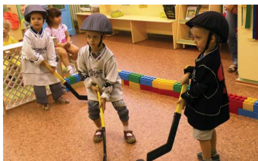
Подпись к фото