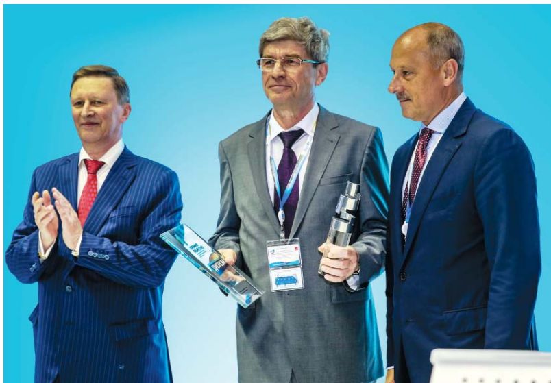
Подпись к фото