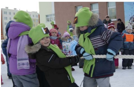
Подпись к фото