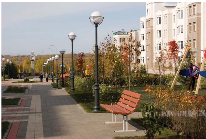
Подпись к фото