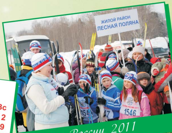
Лыжня России 2011