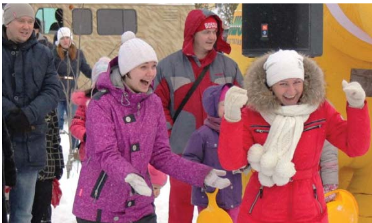
Подпись к фото