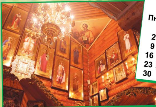
Часовня Матроны Московской