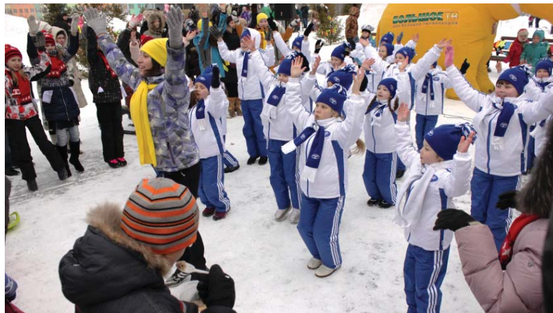
Подпись к фото