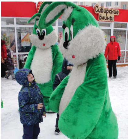
Подпись к фото