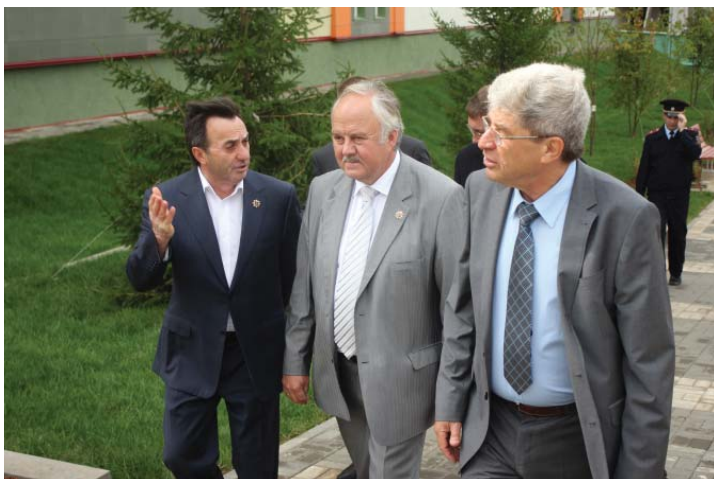
Подпись к фото