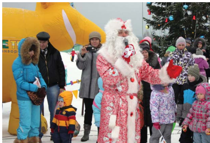
Подпись к фото