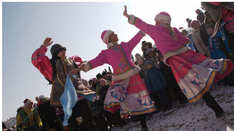
Какое веселье без танцев?