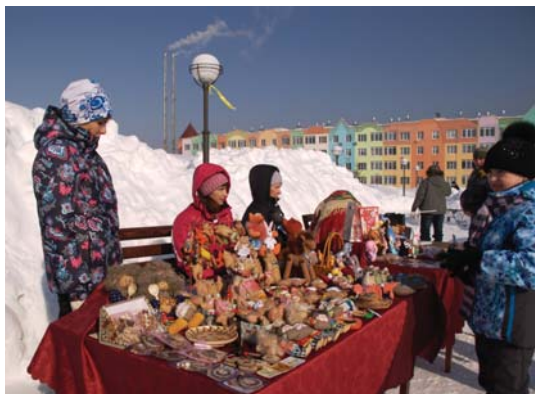
На ярмарке можно было купить сувениры на любой вкус.