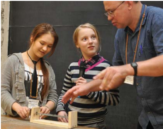
Не может быть!

– Когда мне предложили войти в состав школьной команды, я немного растерялась – за плечами ни одной физической формулы и закона. Но, увидев задачи турнира, поняла, что это интересно, и с радостью начала готовиться. Поначалу было трудно, результаты экспериментов были отрицательными. В связи с олимпиадами был большой перерыв в подготовке. Сейчас же, оглядываясь назад, я понимаю, что нужно было начинать готовиться раньше. Ведь задачи не имеют однозначного решения, в них нельзя, как в школьных задачах, опираться только на теорию, необходимо ставить эксперименты.