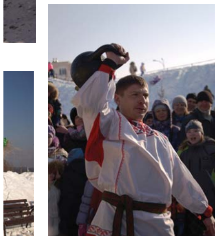
Не перевелись еще богатыри.