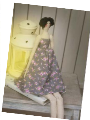
Подпись к фото

это лишь одна из заветных корбочек, в которых хранятся синтепон, пуговички, тесемки, ткани. Благодаря мастерству хозяйки из отдельных деталей они со временем становятся единым целым, превращаясь в милую Принцессу или загадочную Тильду.