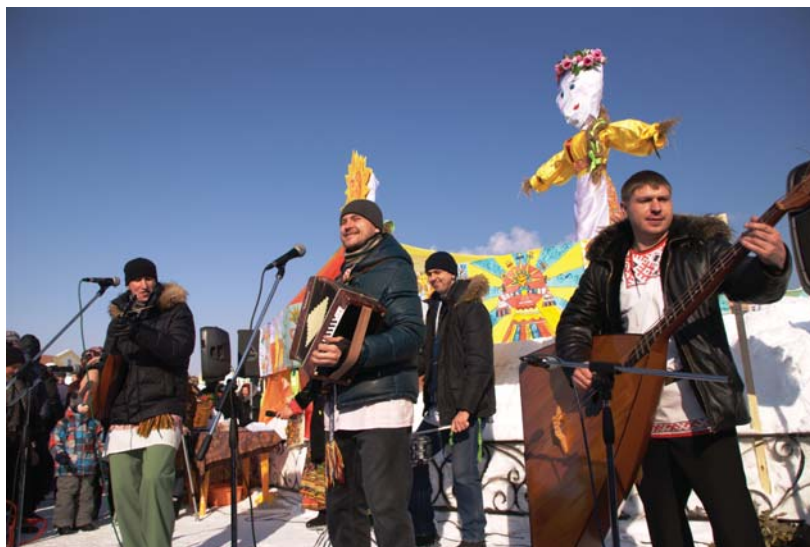
Выступление коллектива «Земляки» произвело настоящий фурор.