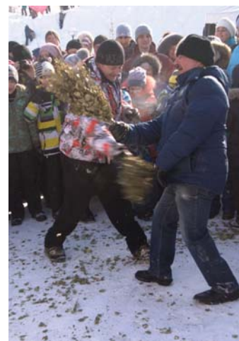
Петрович, поддай парку!