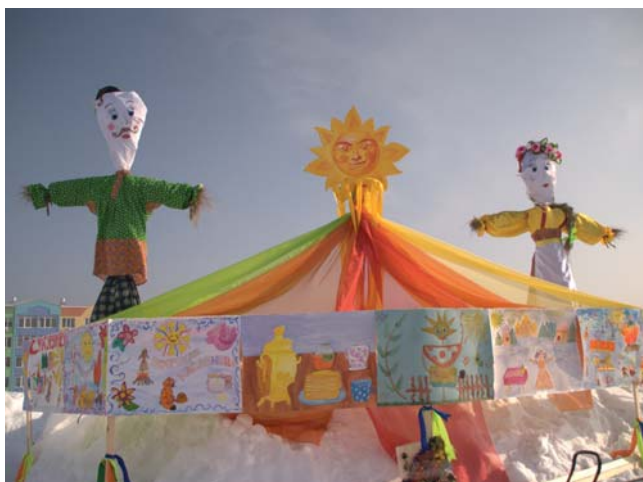
Рисунки, сделанные учениками гимназии №42, украсили праздник.