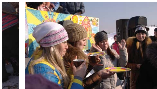
Блинолюбы без угощений не остались.