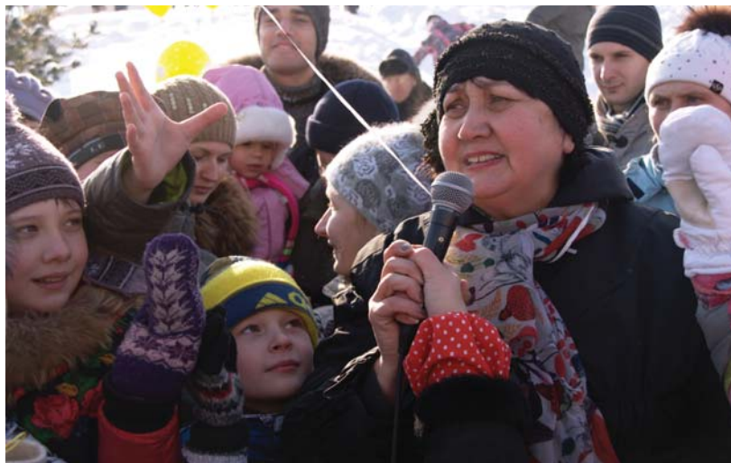
Где мои семнадцать лет, где моя тужурочка, где мои три жениха Ваня, Петя, Шуручка!