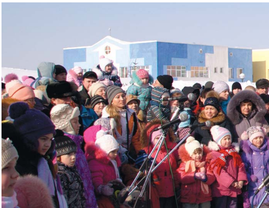
На праздник пришли не только жители Лесной поляны, но и гости района.