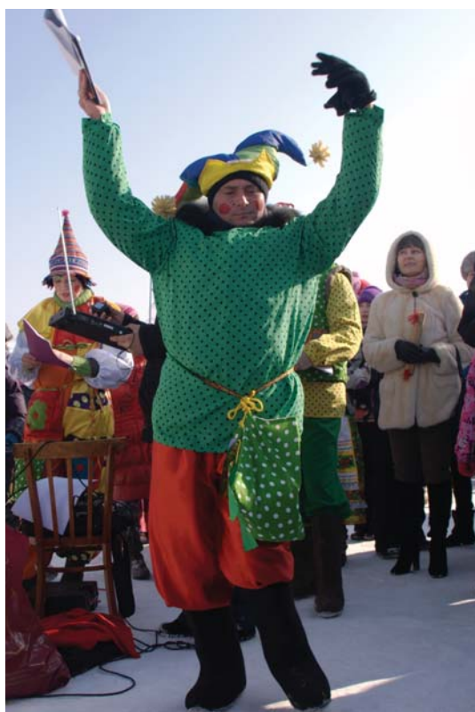
Ай да в пляс!