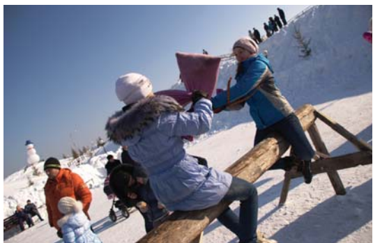
Все разногласия можно решить на бревне с мешками.