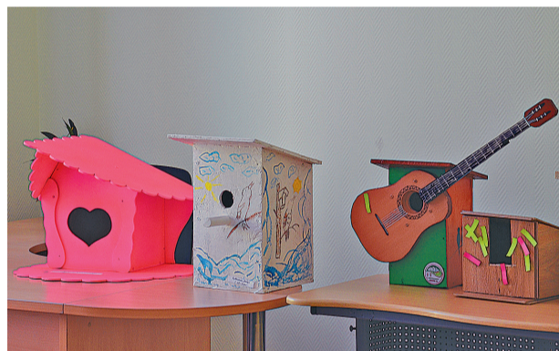
ФОТО ТУ Ж/Р ЛЕСНАЯ ПОЛЯНА

15 марта были подведены итоги конкурса «Скворечники для птиц». На конкурс было заявлено 34 работы. Методом голосования было выбрано 5 лучших. Участниками в птичьих хлопотах и в помощи пернатым стали жители района и учащиеся школы №85 и гимназии №42.