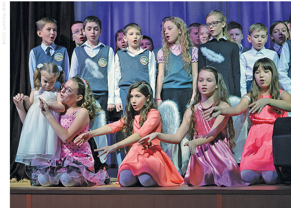
ФОТО ШКОЛЫ №85

Цветы, мягкие игрушки, ангелы, вспышки света, объективы видеокамер – все смешалось в праздничной суете седьмого марта. Из каждого кабинета звучат, сливаясь в унисон, детские голоса. Всего неделя репетиций, волнительных ожиданий, и на сцену уже выходят дружные хоровые коллективы.