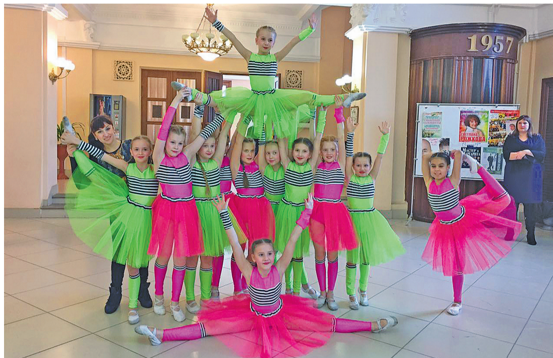
Танцоры-победители всероссийского конкурса «Золотая Ника»

Центр дополнительного образования гимназии №42