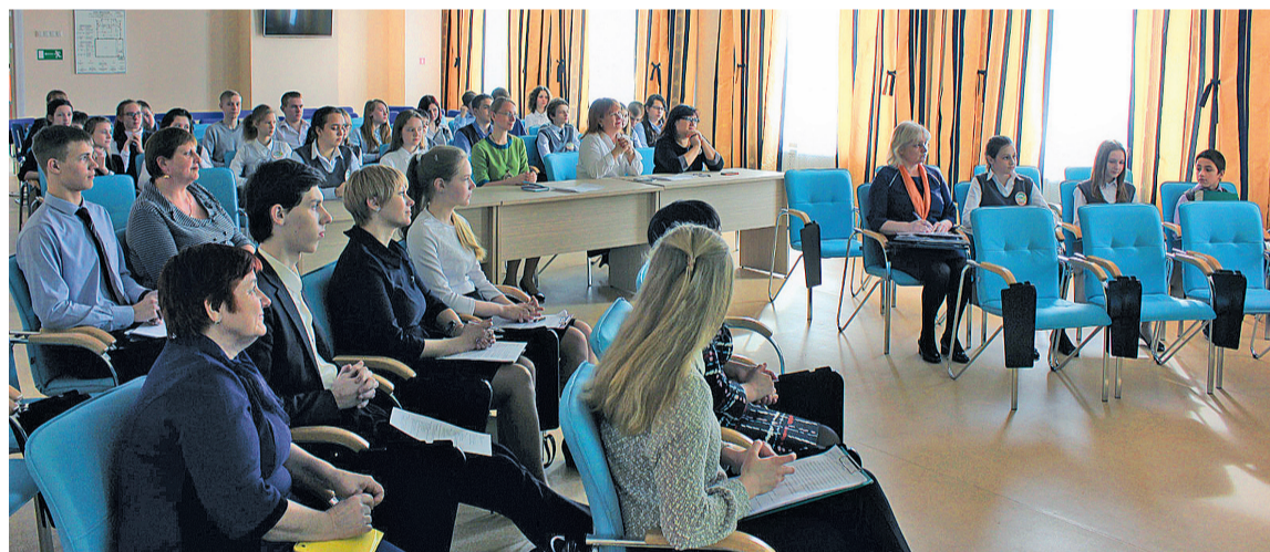
ФОТО ШКОЛЫ №85

Школьная научно-практическая конференция собрала любознательных учащихся и педагогов школы №85 для совместных открытий. Ребята представили результат своих исследований в области гуманитарных и точных наук.