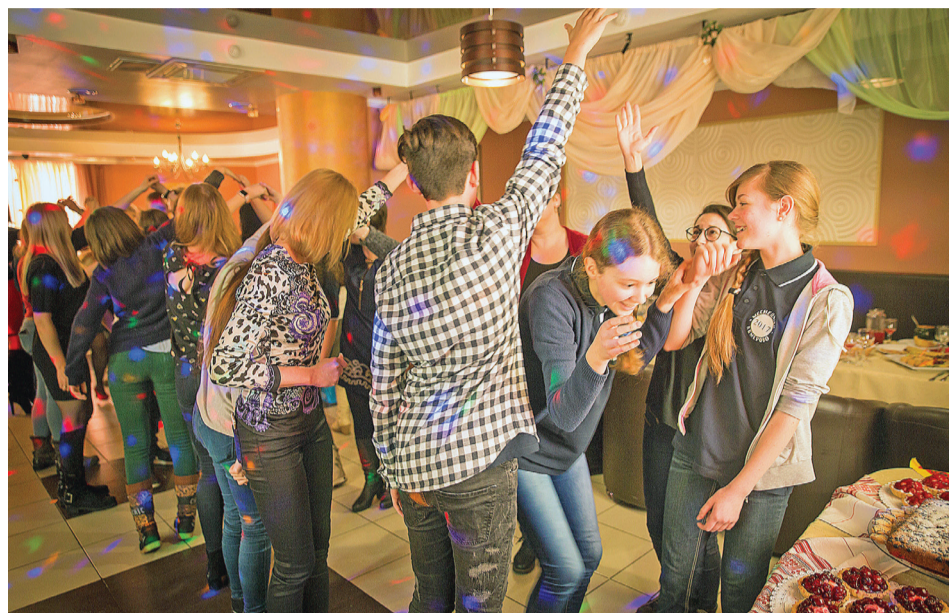
Русские и немецкие ребята водили хороводы, играли в ручеек, учились танцевать немецкую польку.