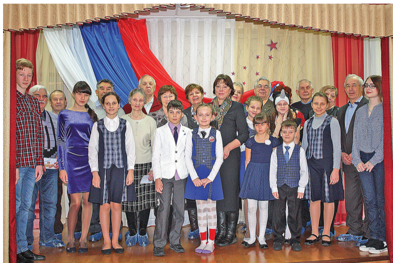
Артисты, организаторы концерта и ветераны Лесной Поляны.